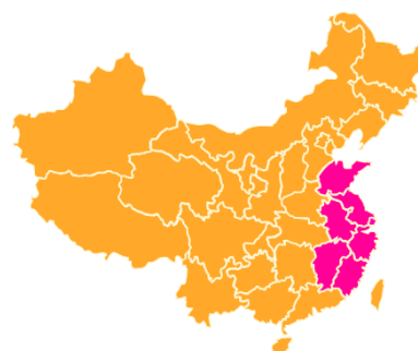
<중국 신생아 수, 중국 국가위생계획출산위원회(2017)>